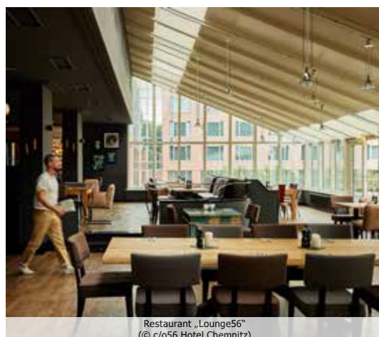
Restaurant „Lounge56“