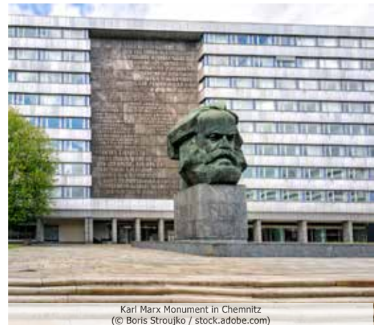
Karl Marx Monument in Chemnitz