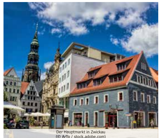
Der Hauptmarkt in Zwickau