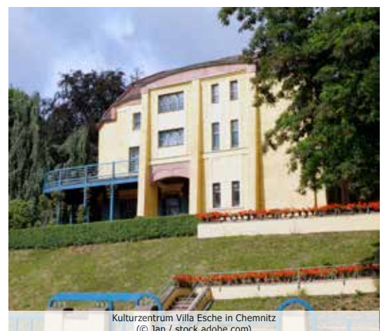
Kulturzentrum Villa Esche in Chemnitz