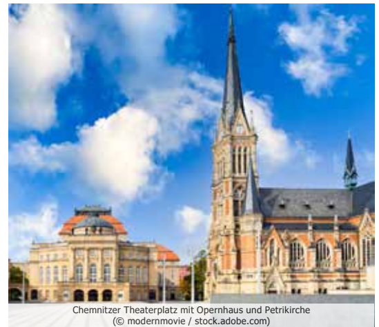
Chemnitzer Theaterplatz mit Opernhaus und Petrikirche

Lassen Sie sich von der Vielfalt dieser Region verzaubern und nehmen Sie unvergessliche Erinnerungen mit nach Hause. (Änderungen vorbehalten!)